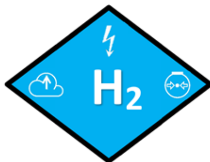
Obrázek 5. Symbol vyvinutý společností CTIF pro vozidlo s FC poháněné stlačeným plyným vodíkem [38]

Příklady symbolů navržených CTIF pro jiné typy vozidel, tradiční a hybridní, jsou uvedeny na obrázku 6.