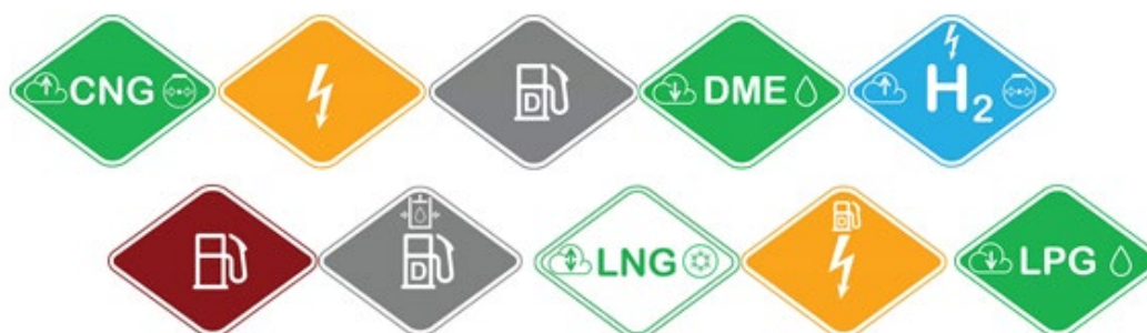
Obrázek 3. Barvy a symboly navržené CTIF pro vývoj standardizovaných značek