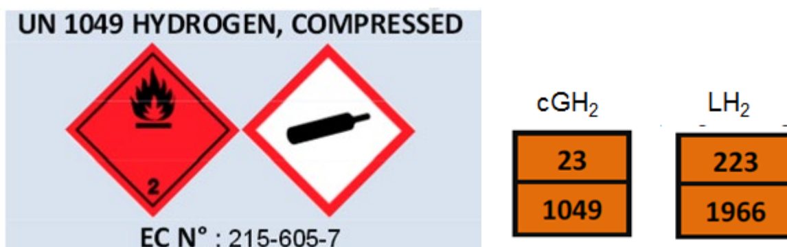
Obrázek 2. Příklady piktogramů používaných pro přepravu vodíku.

Piktogramy pro komerční přepravu vodíku jsou uvedeny na obrázku 2 , kde „1049“ označuje plynný vodík a „1966“ označuje kapalný vodík [36].