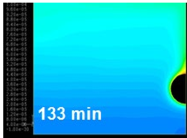
Obrázek 3. Snímek rozptylu prostupujícího vodíku v garážovém prostoru z odk. [13]

Byla také provedena studie CFD s cílem prozkoumat rovnoměrnost rozptylu pronikajícího vodíku v prostoru podobném garáži [13]. Numerické simulace byly provedeny na základě originálního přístupu, kdy byl do rovnice zachování vodíku v kontrolním objemu okolo povrchové plochy nádrže zaveden člen zdroje vodíku. Pronikání bylo simulováno jako objemové uvolňování vodíku v tenké vrstvě kontrolních objemů kolem povrchu nádrže o ploše 1,87 m 2 . Simulace CFD ukázaly zanedbatelnou stratifikaci vodíku. Ukázalo se, že maximální koncentrace vodíku v uzavřené místnosti je vždy na horním povrchu nádrže a nikdy nedosáhne 100 % obj. Analytická analýza i numerické simulace prokázaly, že příspěvek difuze a vztaku k odtahu vodíku z povrchu nádrže jsou shodné do 1 minuty od začátku procesu. Podmínky kvaziustáleného stavu v prostoru s přibližně lineární distribucí vodíku shora dolů se pro uvažované rychlosti prostupu dosáhne přibližně za 1 hodinu. Například maximální koncentrace vodíku v čase 133 min na horním povrchu nádrže byla 8,2 \times 10^{-3} obj. % (obrázek 3). Zjištěný rozdíl v koncentraci vodíku mezi stropem a podlahou je přibližně 3 \times 10^{-3} obj. % a tento rozdíl se v čase zachovává. Obě hodnoty jsou výrazně nižší než LFL 4 % obj.